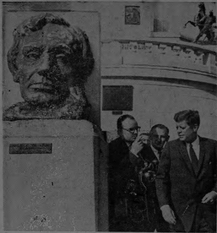
El Presidente John F. Kennedy se aleja de la tumba de Abraham Lincoln, en Springfield, Illinois, después de dejar en la misma una ofrenda floral. Lincoln fue el primer Presidente afiliado al Partido Republicano. Pero la actitud fue distinta por parte del Presidente con respecto a otros dirigentes actuales de dicho partido, durante el recorrido que por siete estados y durante tres días ha llevado a cabo haciendo campaña en favor de candidatos demócratas. Kennedy atacó en sus discursos al senador Everett M. Dirksen (republicano por Illinois), líder de la minoría senatorial.