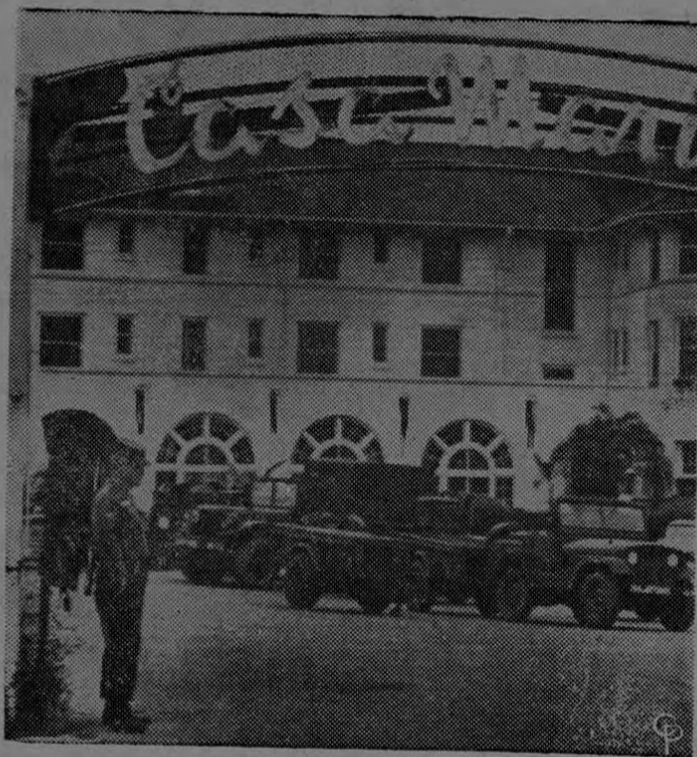
Armado con un rifle, un centinela custodia la entrada del hotel Casa Marina, en Cayo Hueso, que fue alquilado al ejército. Este movió proyectiles antiaéreos hacia la ciudad, situada a 90 millas (144 kilómetros) al Norte de La Habana. Se ha informado que hay instalaciones de radar y equipo antiaéreo en la cadena de islotes que comunican con tierra firme, hacia el Este y el Norte de Cayo Hueso.