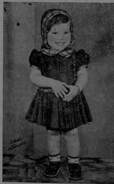
OS DEDICO MIS HUMILDES PENSAMIENTOS

Proseguiré por mi camino con mi alma esperanzada pensando en mi destino seguiré con mi balada.