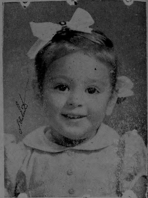
Como una humilde primicia

No soy Reina ni Sultana sólo soy cual picaflo que engalana la mañana mientras llora en su dolor.